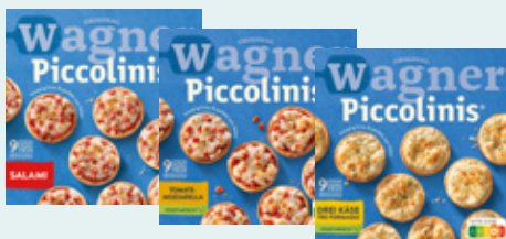
Piccolini Wagner, doos 9 stuks, Salami Art. nr. 95925060 Tom. mozzarella Art. nr. 95127189 Drie kazen Art. nr. 95195356