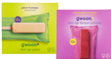
Fruit waterijs G'woon, pak 12 stuks, Perensmaak Art. nr. 95609238 Bosvruchten Art. nr. 95924452