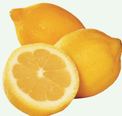
Citroenen TotaalVERS, per stuk, Art. nr. 20001100