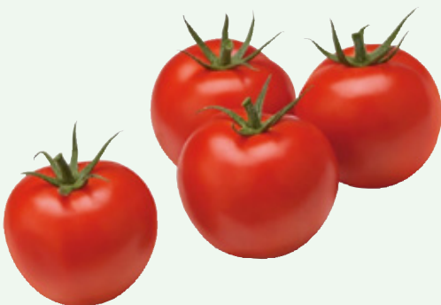
Tomaten TotaalVERS, per stuk, Art. nr. 20000227