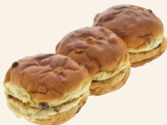
Rozijnenbol Bakkerij Pot, zak 6 stuks, Art. nr. 60000477