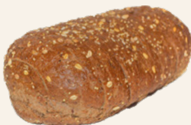
Multi-woudkorn Remmerswaal, gesneden Art. nr. 61131831