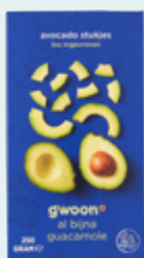
Avocado fruitstukjes G'woon, doos 250 g, Art. nr. 95182973