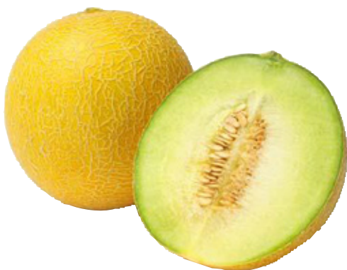
Galia meloen TotaalVERS, per stuk, Art. nr. 20001540