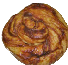
Zeeuwe bolus Remmerswaal, per stuk, Art. nr. 61264701