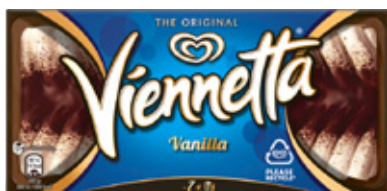
Vienneta vanille Ola, doos 650 gram, Art. nr. 95281119