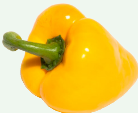
Paprika geel TotaalVERS, per stuk, Art. nr. 20000261