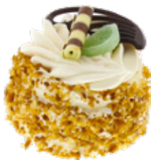
Hazelnoot schuimgebak Bakkerij Pot, per stuk, Art. nr. 60005475