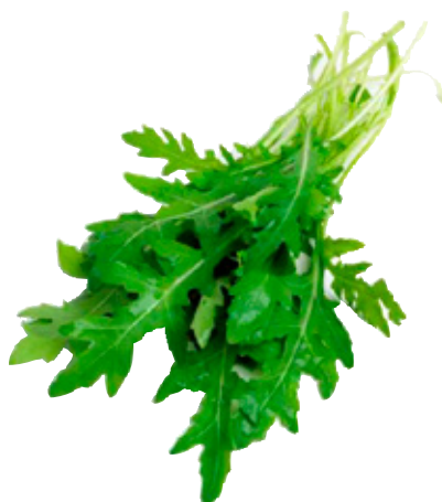
Rucola TotaalVERS, bak 125 g, Art. nr. 20000112