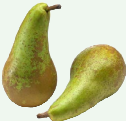
Handperen TotaalVERS, per stuk, Art. nr. 20000708